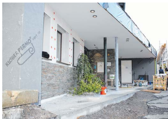
Auch das neu gestaltete Eingangportal des Bludener Hotelbetriebs nimmt bereits konkrete Formen an.

fertig“, kann Dörflinger erfreut berichten. Die Fassade im Eingangsbereich ähnelt schon verdächtig jener auf dem Plan des Architekturbüros Achammer, und auch die sechs neu geschaffenen Doppelzimmer nehmen allmählich Gestalt an. Die Badezimmer sind bereits fertiggestellt, und auch die neuen Tapeten geben den Räumen über dem Restauranttrakt