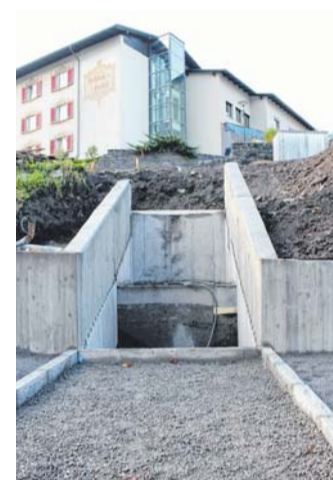
Die neue Außenanlage ist derzeit noch Großbaustelle.

Im Außenbereich sieht es hingegen noch etwas anders aus. Dieser wird jetzt im November erst so richtig in Angriff genommen. Neben einem kürzeren Zugang zum Hotel werden auch zwölf neue Parkplätze entstehen. Die markanteste Verände-