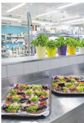
Seit rund zwei Monaten ist die erweiterte Küche wieder in Betrieb.

„Die Sanierungsarbeiten biegen nun endgültig auf die Zielgerade. Rechtzeitig vor der Wintersaison ist alles