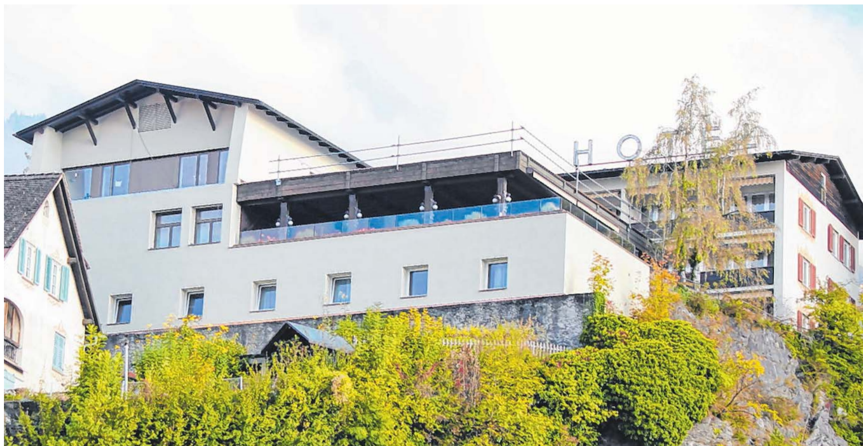
Die Arbeiten an der südlichen Fassade des Hotels konnten bereits abgeschlossen werden.