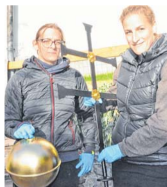
Das frisch renovierte Turmkreuz der St. Antoniuskirche.