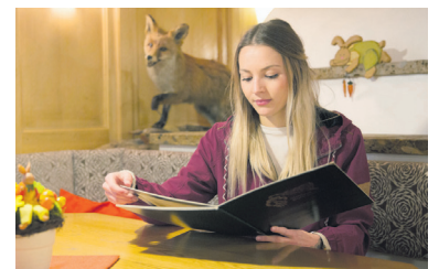
Traditionelle Küche im Gasthaus Fuchs.