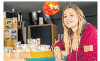
Perfekt, um den Abend ausklingen zu lassen: Die Bar Herr Muk in der Rathausgasse.